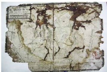
Quartier de Flacq : Archives Nationales de l'Île Maurice.