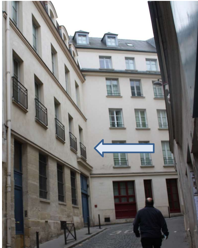
Vue du 13 et 15 rue des Boulangers en 2014. J.Barret et P.Commerson habitent au n°13 et leur propriétaire au n° 15