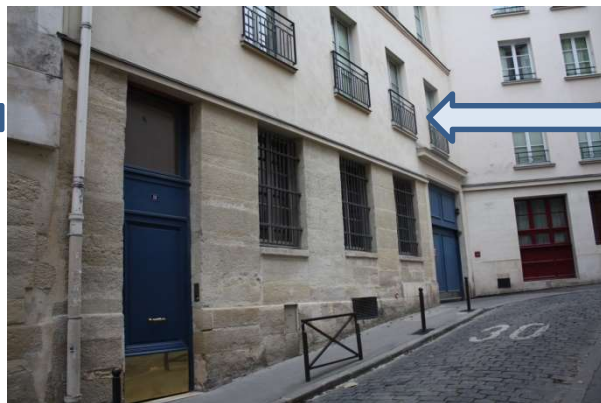
(G.) Vue du 13 rue des Boulangers en 2014. J.Barret et P.Commerson habitent au 2 e étage.